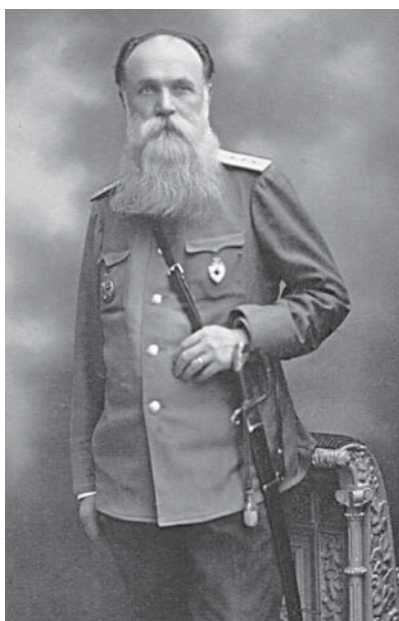
Рис. 1. Ф.Ф. Яницкий.

После окончания университета Ф.Ф. Яницкий был мобилизован на Русско-турецкую войну (1877–1878 г.) и более 40 лет (за исключением 1882–1889 г., когда он служил земским врачом) оставался военным врачом. Во время Русско-турецкой войны Ф.Ф. Яницкий работал ординатором в госпиталях действующей армии на Кавказском театре военных действий. Безусловно, школа Пирогова отразилась на врачебной работе Ф.Ф. Яницкого и его взглядах [1]: недавний выпускник университета, свою первую врачебную «школу» он прошел именно на Кавказском фронте Русско-турецкой войны, где служил Н.И. Пирогов.